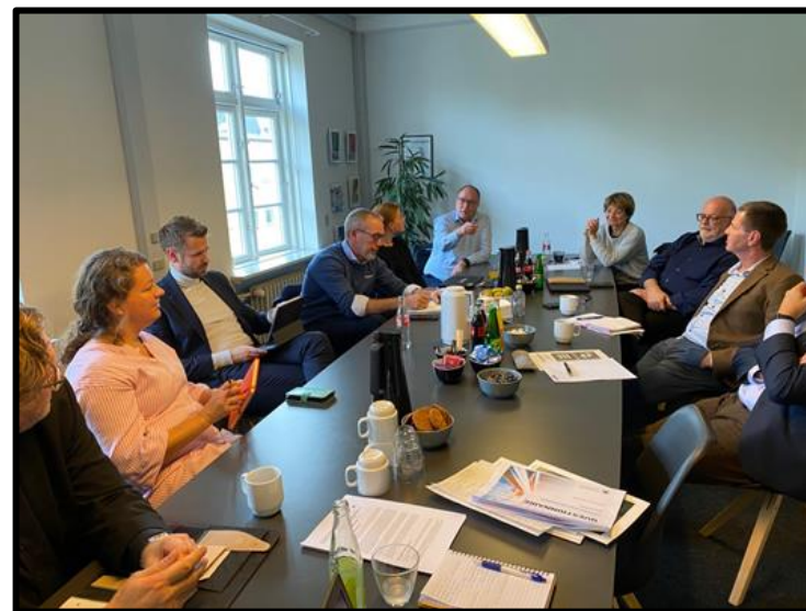
Første møde det sønderjyske lokalnetværk 10. oktober 2022.

Vi havde KICK-OFF møde i lokalnetværket den 10. oktober 2022, hvor vi 7 lokale medlemsvirksomheder deltog sammen med 3 potentielt nye medlemmer. Fokus på mødet var værdiskabende rapportering med afsæt i den nye ramme for "Communication on Progress".